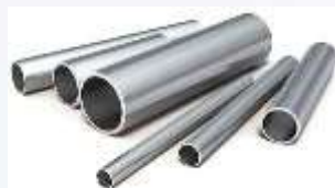
Трубы стальные - 19%