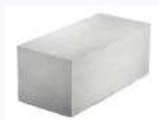
Блоки из ячеистых бетонов - 17%