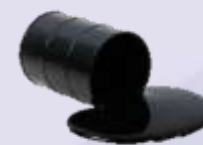
Битум - 27%