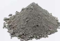
Портландцемент - 18%