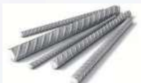
Сталь - 29%